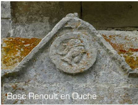
Bosc Renoult en Ouche