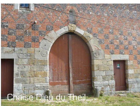
Chaise Dieu du Theil